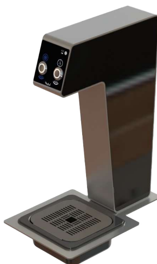
Version 2 distributions EF-EG avec 2 capteurs infrarouge (détection main)