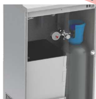
Porte permettant d'accéder aux composants, à la bouteille de CO 2 et aux recharges de sirop

Internal dispensing nozzles to avoid any risk of bio-contamination