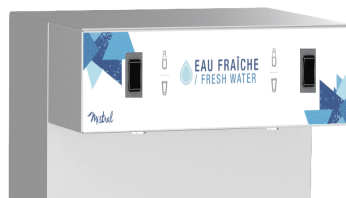
Buses de distribution internes pour éviter tout risque de bio-contamination

Compatible avec le système anti-fuite Watersafe® (en option) Compatible with Watersafe® system (in option)